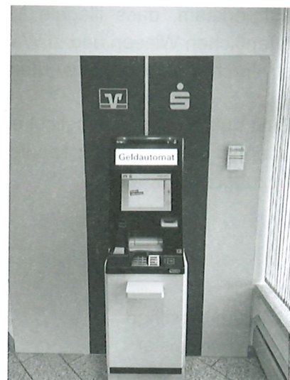
Beispiel Geldautomat Filiale Gepsattel

Zusätzlich sind in näherer Umgebung die Filialen der VR-Bank Mittelfranken West eG in Geslau, Leutershausen und Lehrberg für Sie geöffnet und mit Kundenserviceterminals ausgestattet.